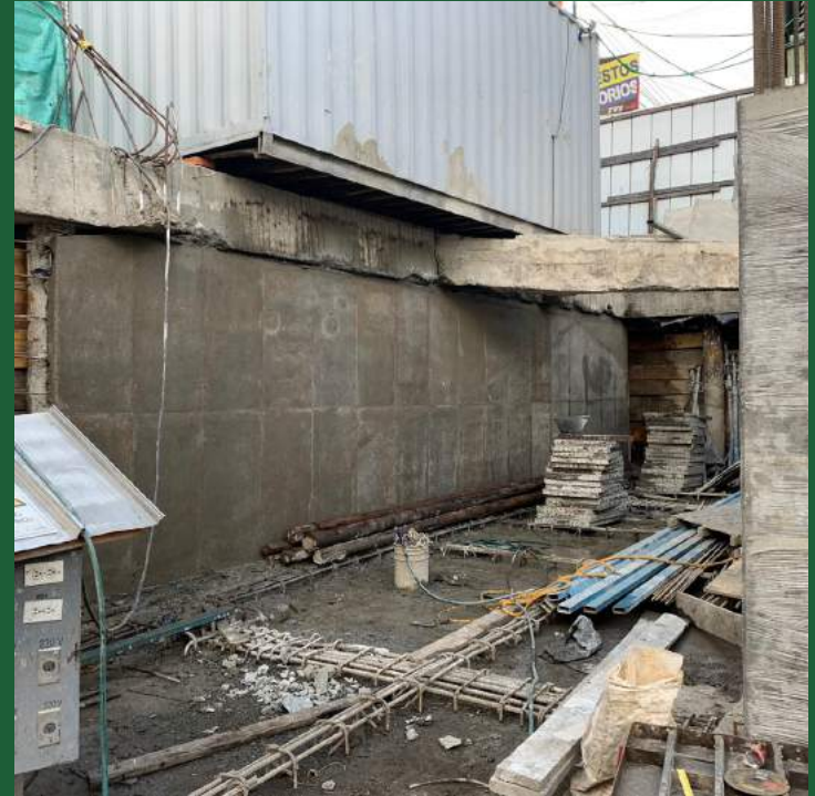
Muro contención 100%