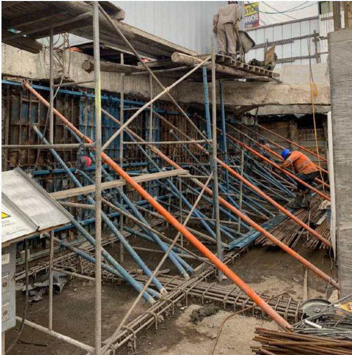
Armado muros contención